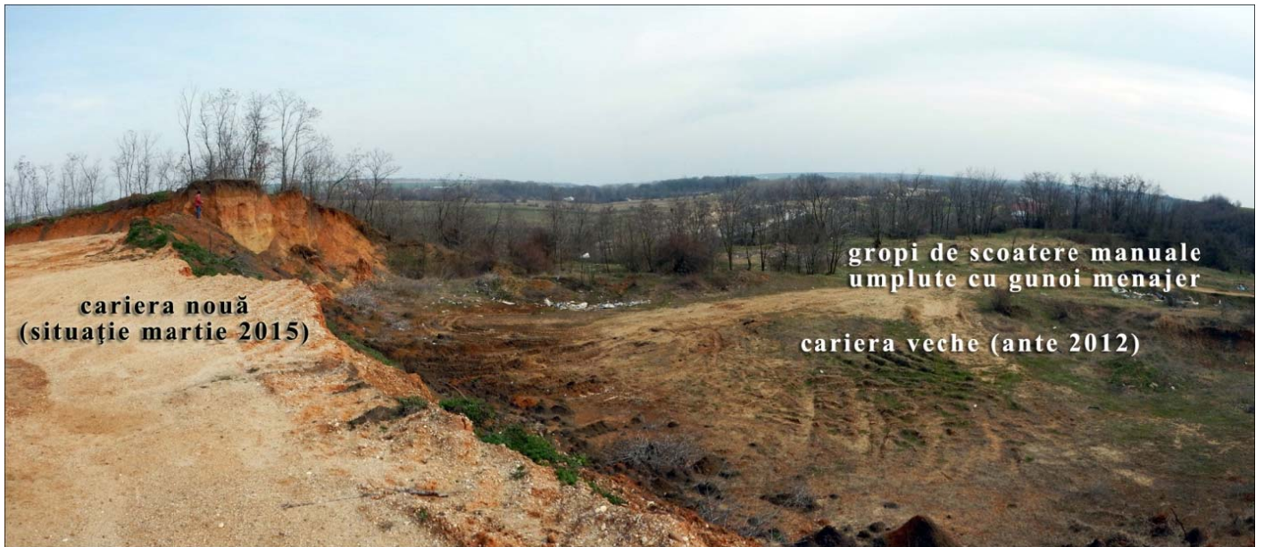
Figura 2. Limita dintre cariera veche și cea nouă. Vedere spre SE. În plan îndepărtat, stânga – scara umană, respectiv un bărbat de peste 1,8 m.