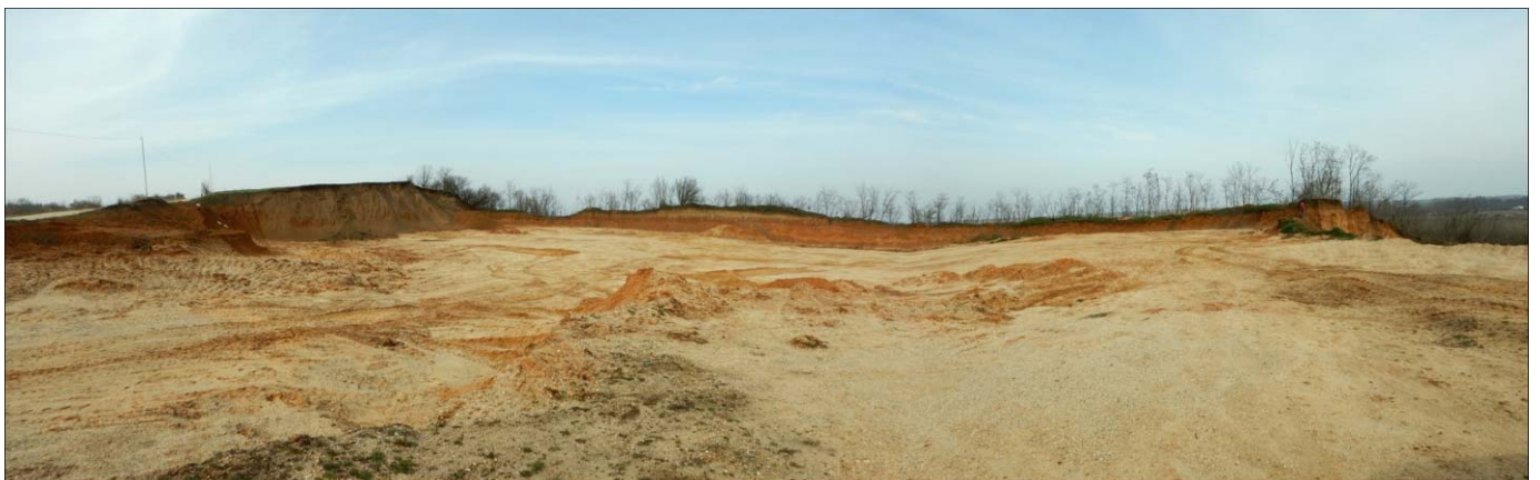
Figura 3. Vedere spre cariera nouă, luată din aproximativ aceeași poziție cu anterioara, dar spre nord. În plan (foarte) îndepărtat, dreapta, același etalon de mărime ca la figura anterioară.